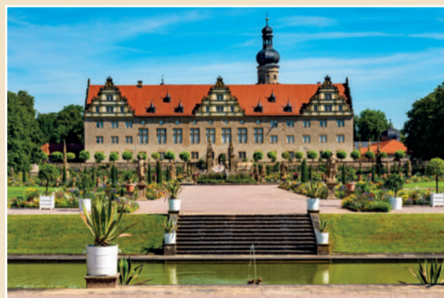
Renaissanceschloss mit Park und Orangerie in Weikersheim

DE Fachwerk, Burgen und Schlösser, hügelige Weinberge, wildromantische Natur und eine jahrhundertalte Geschichte, das Liebliche Taubertal macht seinem Namen alle Ehre. Denn es verdankt seinen Namen dem Fluss Tauber, der sich von Rothenburg ob der Tauber im Süden bis nach Wertheim am Main im Norden schlängelt und in weiten Bögen mal durch Baden-Württemberg, mal durch Bayern fließt. Mit seiner idyllischen Landschaft, historischen Städten und malerischen Dörfern bietet das Taubertal eine Fülle von Freizeitmöglichkeiten und kulturellen Schätzen, ob auf einem Roadtrip entlang der Romantischen Straße oder auf ausgezeichneten Rad- und Wanderwegen.