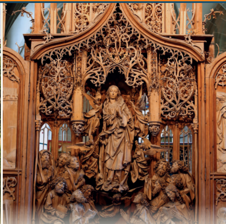
Marienaltar von Tilman Riemenschneider in der Herrgottskirche in Creglingen

Zahlreiche Burgen, Schlösser und Klöster zeugen von der langen Geschichte des Taubertals. Das prachtvolle Renaissanceschloss in Weikersheim, der Marienaltar von Tilman Riemenschneider in Creglingen oder das beeindruckende Kloster Bronnbach bei Wertheim sind nur einige Beispiele. Eine der größten Burganlagen Süddeutschlands, die Burg Wertheim, ist Schauplatz für Konzerte oder Open-Air-Highlights wie das Burgfilmfest. Zu Burgfestspielen lädt die malerische Stadt Freudenberg am Main die Besucherinnen und Besucher auf die Burg Freudenberg ein. Das Kurmainzische Schloss in Tauberbischofsheim mit dem Tauberfränkischen Landschaftsmuseum und dem berühmten Türmersturm auf dem Schlossplatz ist ebenso einen Besuch wert. Nicht zu vergessen sind die zahlreichen Museen der Region, denn das Liebliche Taubertal ist eine eigene Museumswelt für sich. Neben diesen kulturellen Schätzen findet man in den Kloostergärten und Schlossparks Oasen der Ruhe.