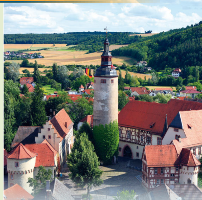
Kurmainzisches Schloss in Tauberbischofsheim

NL Vakwerkhuzen, kastelen en paleizen, heuvelachtige wijngaarden, wilde en romantische natuur en eeuwenoude geschiedenis – het "Lieflijke Taubertal" doet zijn naam eer aan. Het dankt zijn naam aan de rivier de Tauber, die van Rothenburg ob der Tauber in het zuiden tot Wertheim am Main in het noorden kronkelt en met grote bochten door Baden-Württemberg en Beieren stroomt. Met zijn idyllische landschap, historische steden en pittoreske dorpen biedt het Taubertal een schat aan vrijetijdsmogelijkheden en cultuurschatten, zowel tijdens een autorit over de rue romantique als tijdens uitstekende fiets- en wandelroutes.